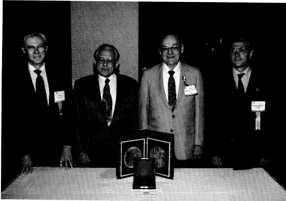
Brock Gold Medal Award Winners