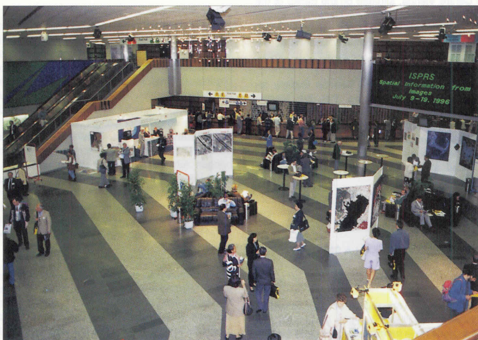
The Austria Centre Vienna