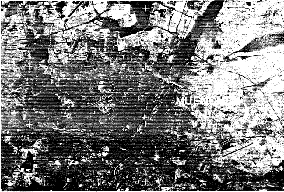
Orthophoto 1 : 200 000