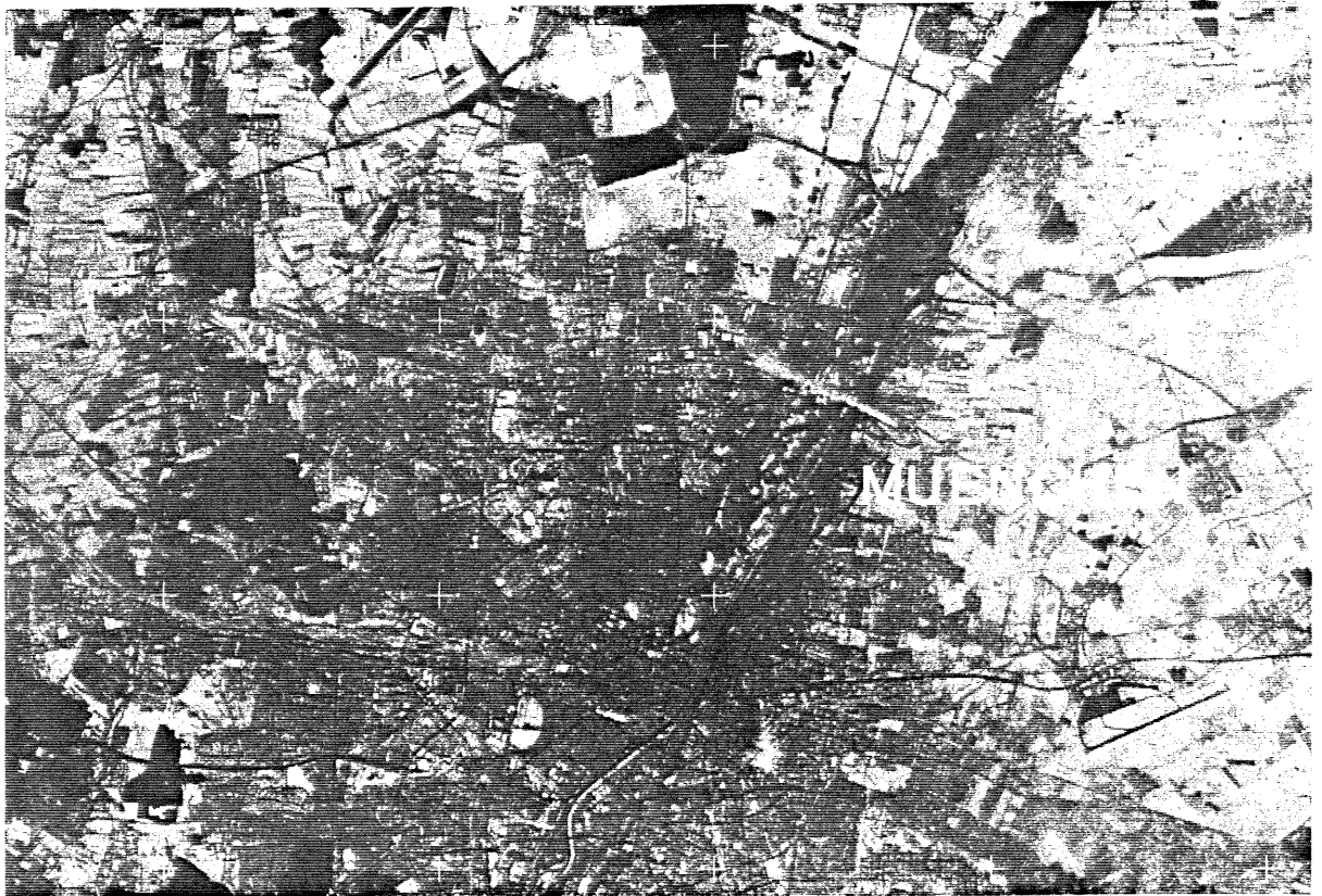
Orthophoto 1 : 150 000