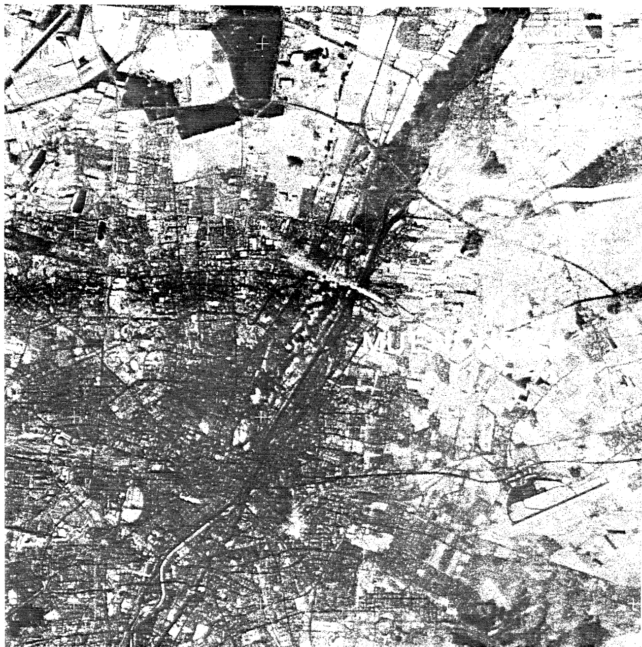
Orthophoto 1 : 100 000