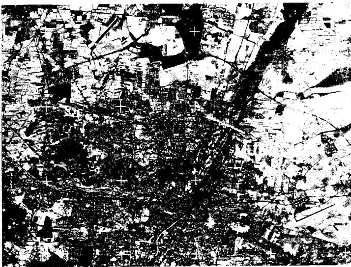
Orthophoto 1 : 250 000