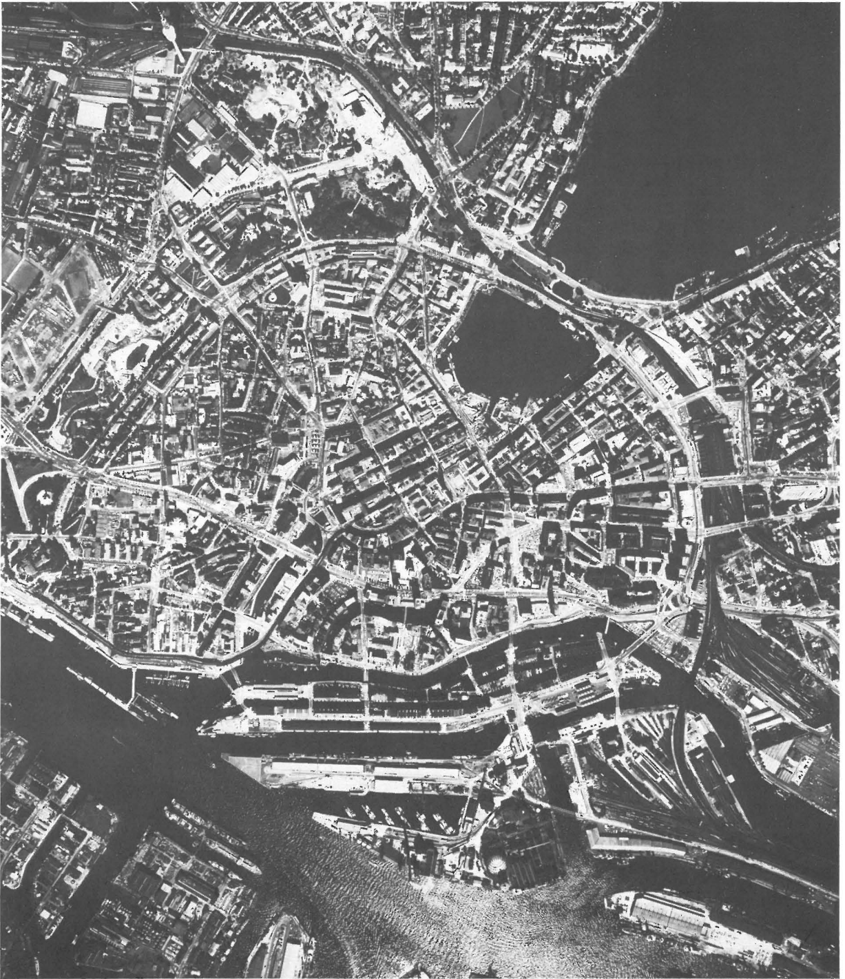
Aerial photograph of the centre of the City of HAMBURG, Federal Republic of Germany